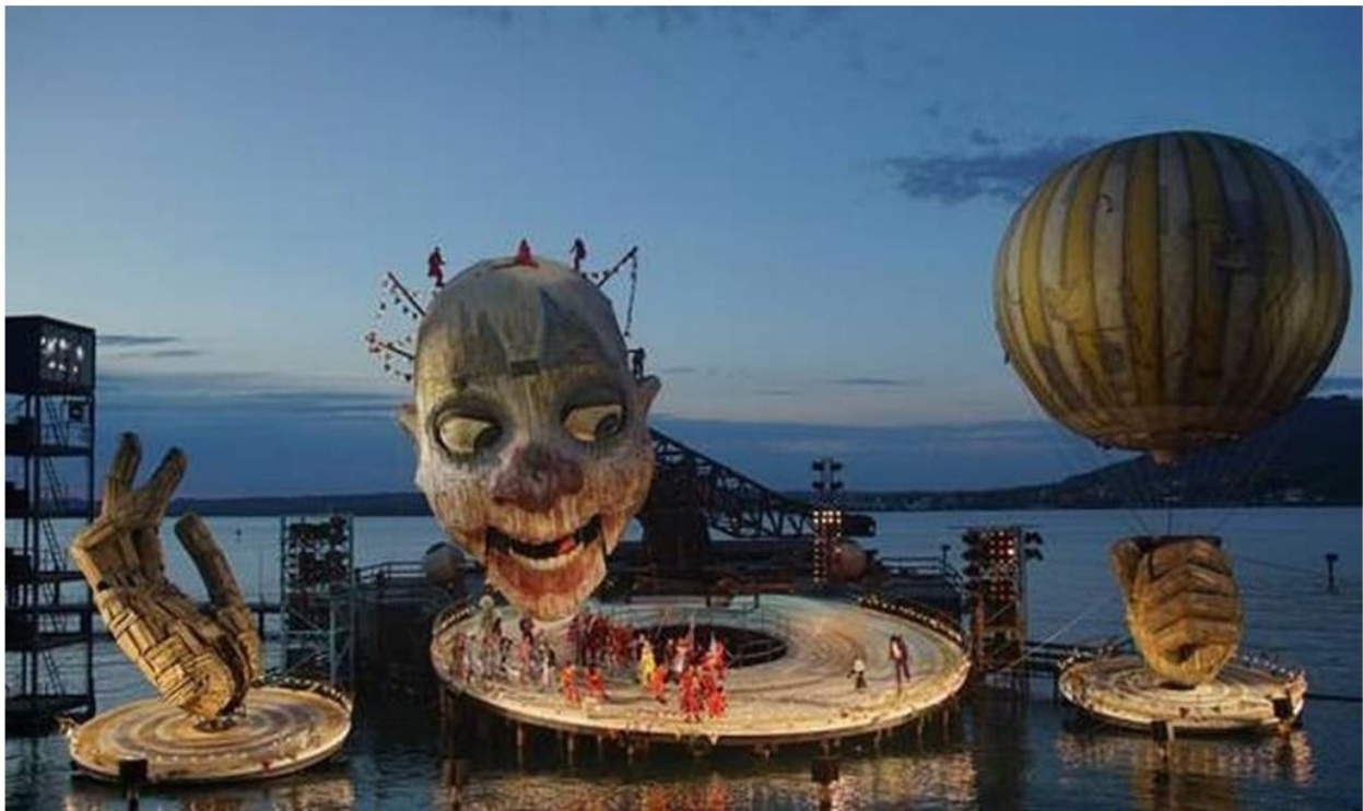
'Rigoletto', obra muito popular encenada no deslumbrante palco flutuante do Festival de Bregenz

Parque Lage: Rua Jardim Botânico 414, Jardim Botânico — 2334-4088. Seg a sáb, às 19h. Dom, às 18h. R$ 24. 14 anos