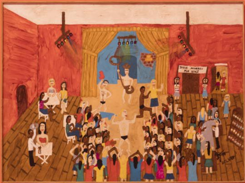
CASSIA DRUMMOND Cidade de Pedra, 1978 Óleo sobre tela, 100 x 100 cm DALVAN Jesus morreu por você, 1984 Óleo sobre tela, 100 x 100 cm GABRIELE GOMES Sem título, 2018 Acrílico sobre tela, 100 x 100 cm