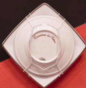
ROSÂNGELA BENNO 1947 - São Paulo, SP, Brasil 1968 - São Paulo, SP, Brasil 1970 - São Paulo, SP, Brasil 1972 - São Paulo, SP, Brasil 1974 - São Paulo, SP, Brasil 1976 - São Paulo, SP, Brasil 1978 - São Paulo, SP, Brasil 1980 - São Paulo, SP, Brasil 1982 - São Paulo, SP, Brasil 1984 - São Paulo, SP, Brasil 1986 - São Paulo, SP, Brasil 1988 - São Paulo, SP, Brasil 1990 - São Paulo, SP, Brasil 1992 - São Paulo, SP, Brasil 1994 - São Paulo, SP, Brasil 1996 - São Paulo, SP, Brasil 1998 - São Paulo, SP, Brasil 2000 - São Paulo, SP, Brasil 2002 - São Paulo, SP, Brasil 2004 - São Paulo, SP, Brasil 2006 - São Paulo, SP, Brasil 2008 - São Paulo, SP, Brasil 2010 - São Paulo, SP, Brasil 2012 - São Paulo, SP, Brasil 2014 - São Paulo, SP, Brasil 2016 - São Paulo, SP, Brasil 2018 - São Paulo, SP, Brasil 2020 - São Paulo, SP, Brasil