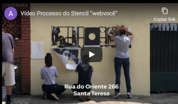
WEBVOCÊ | 204 x 92 cm | stencil de 3 camadas | tinta spray sobre muro

O perfil da turma, apenas 5 pessoas envolvidas neste ofício, um único encontro presencial para fixar a imagem escolhida no muro da casa 266 da Rua do Oriente. Os protocolos quanto ao uso de máscara, distanciamento entre as pessoas e em área ventilada foram respeitados.