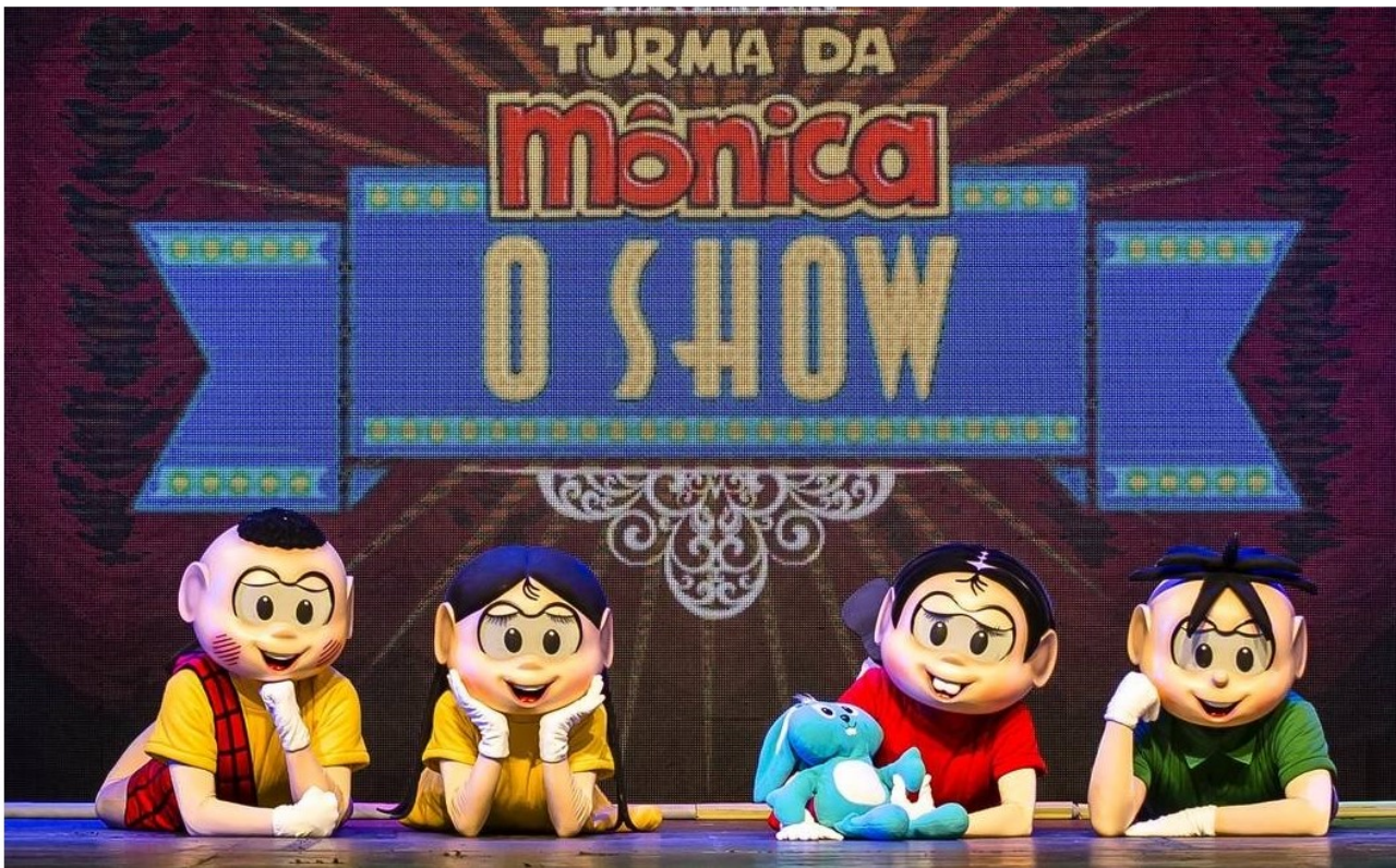
De graça. Musical da Turma da Mônica