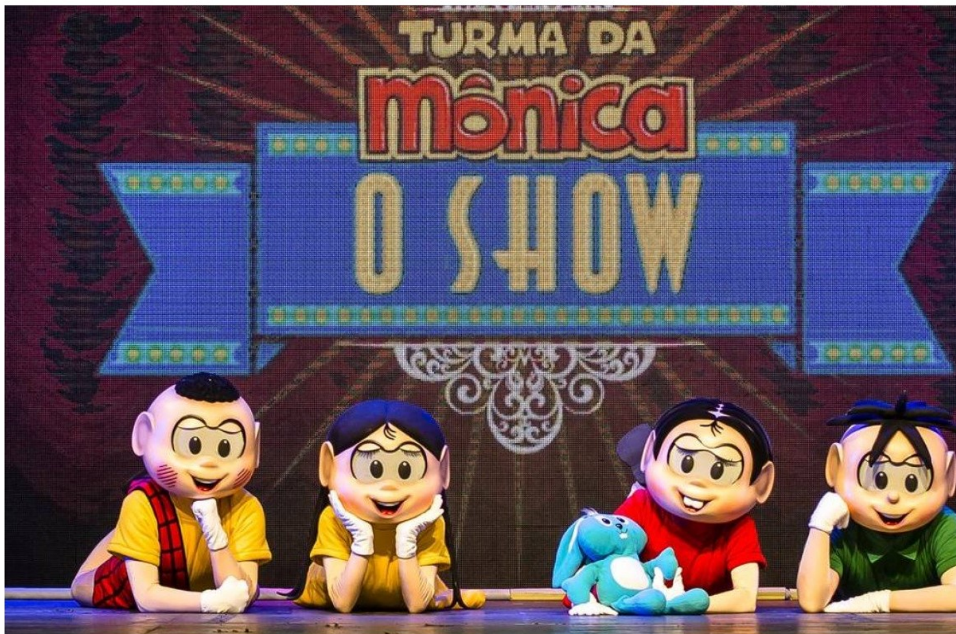
De graça. Musical da Turma da Mônica