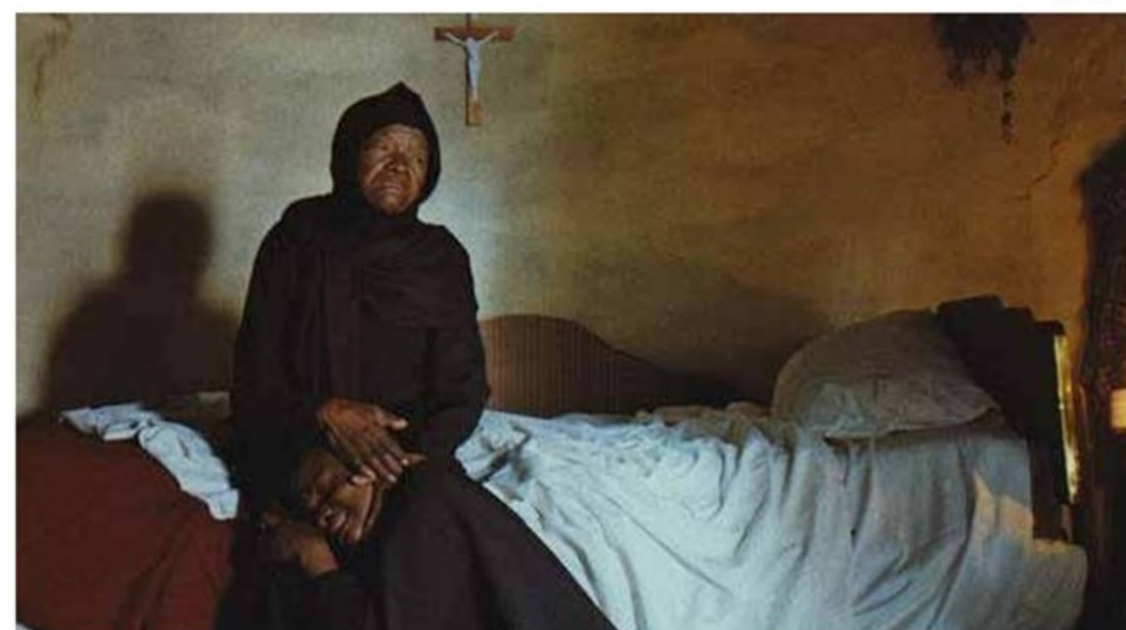
‘Isso Não É Um Enterro...’, de Lesoto, umas das apostas do festival

“CHICO REI ENTRE NÓS”, de Joyce Prado: Retratada em nosso cinema num cult de 1985 de Walter Lima Jr. que passava até na “Sessão da Tarde” na década de 1980, a história de Galanga - monarca guerreiro do Congo capturado por portugueses e escravizado em Vila Rica - retorna agora como narrativa documental de inclusão e resiliência.