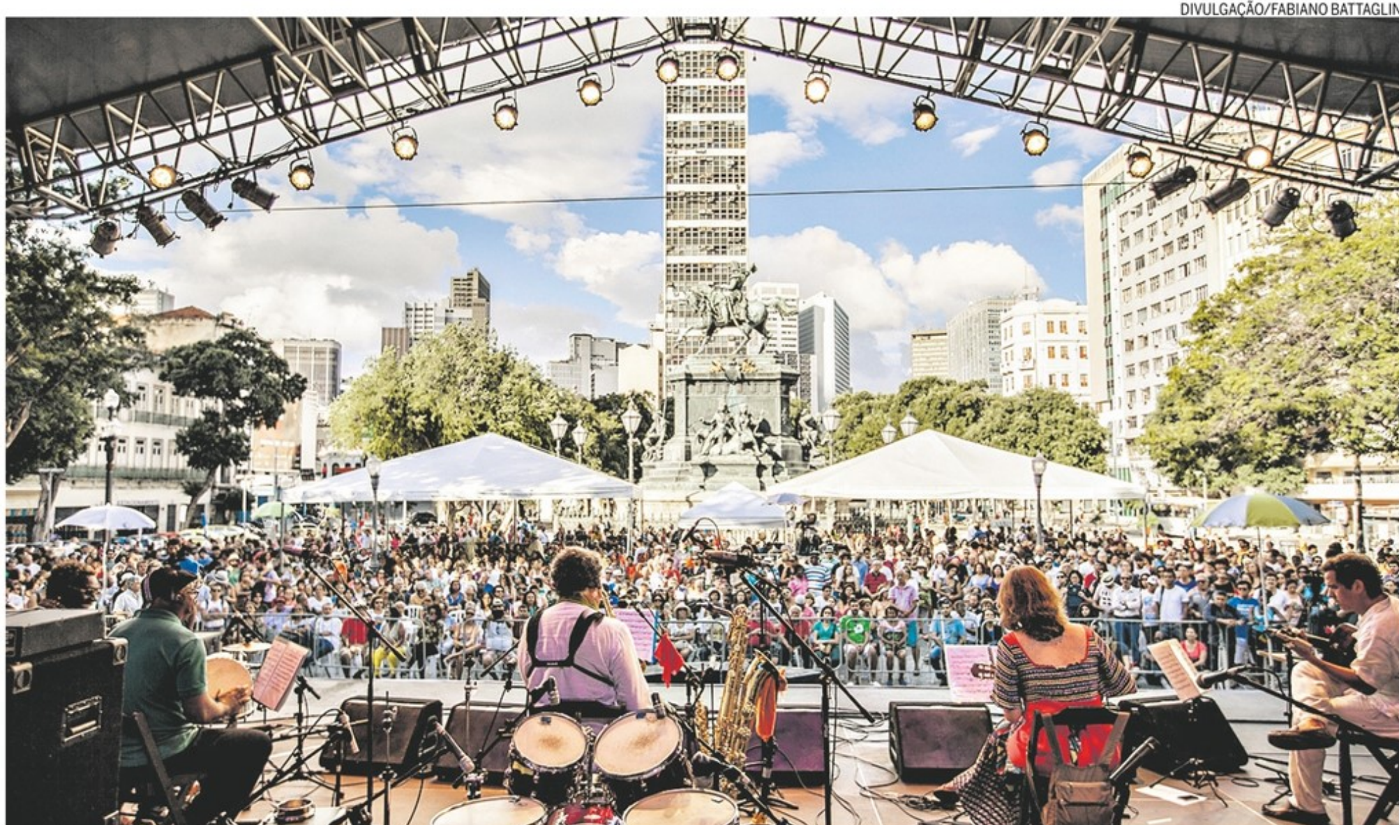
Shows. Apresentações do Festival do Dia Nacional do Choro, realizadas na Praça Tiradentes, estão entre as opções disponíveis no site

Com programação de lançamento gratuita para comemorar 20 anos da Escola Portátil de Música, site reúne acervo do instituto, com depoimentos, partituras e shows; semana que vem Mônica Salmaso homenageia Elizeth Cardoso