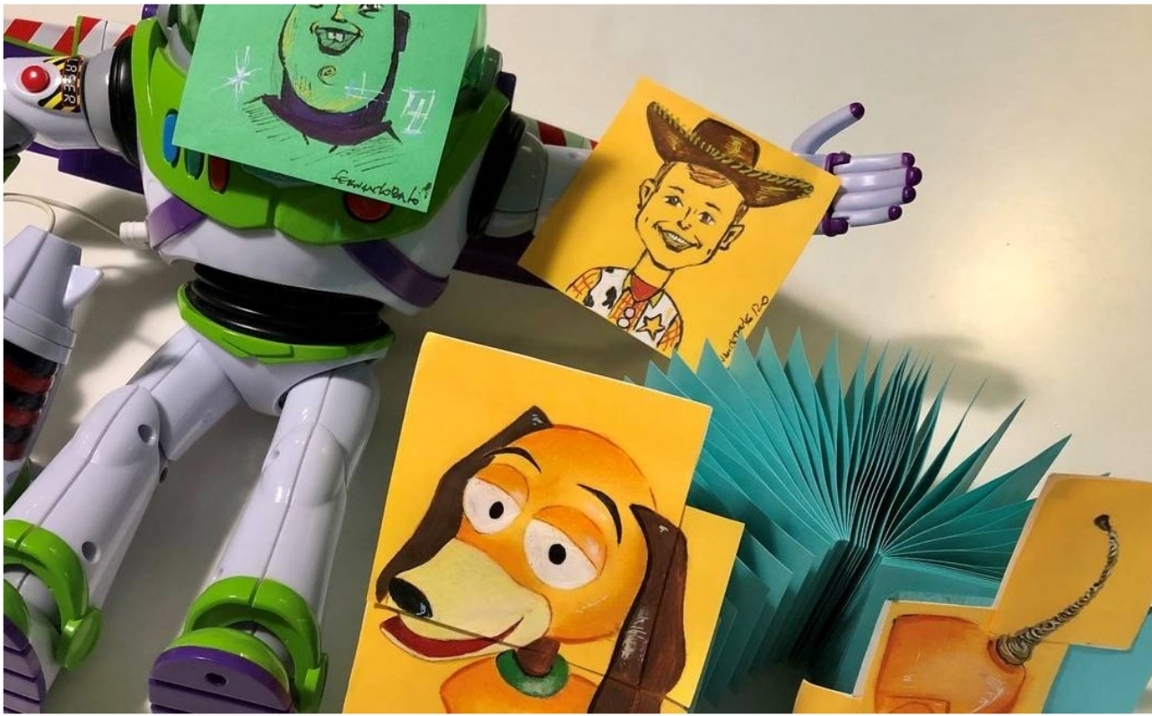
Pixel Show