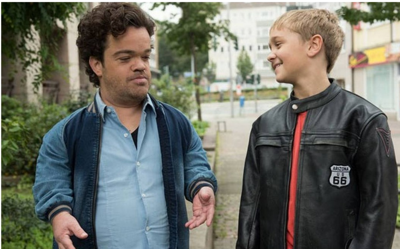
Fici. "Do meu tamanho", filme indicado por Carla Camurati