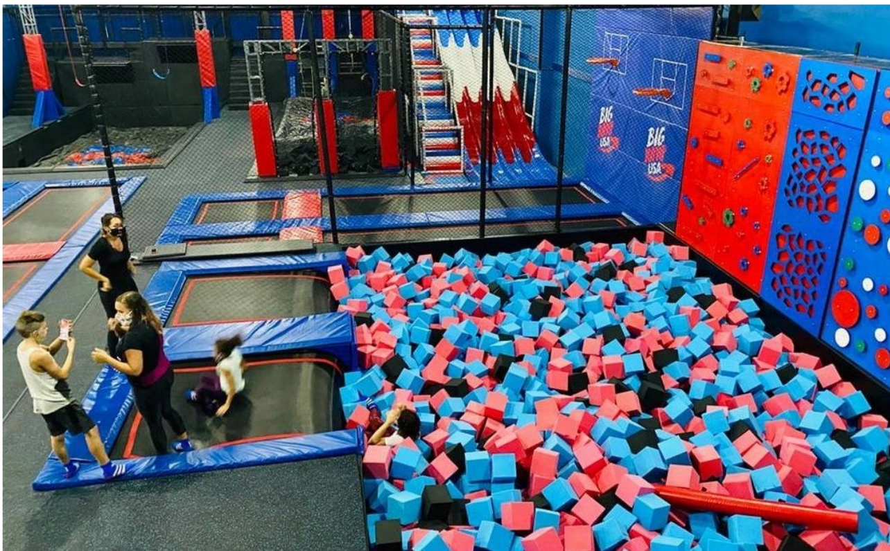
Big Jump USA