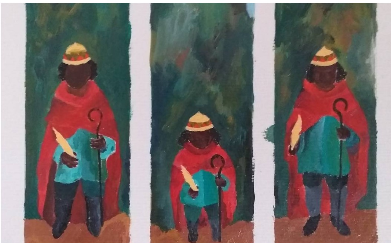
Jornadas de Outubro no Parque Lage : Bernardo Magina