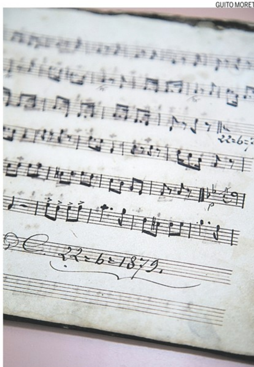
Raridade. Acervo com mais de 18 mil partituras