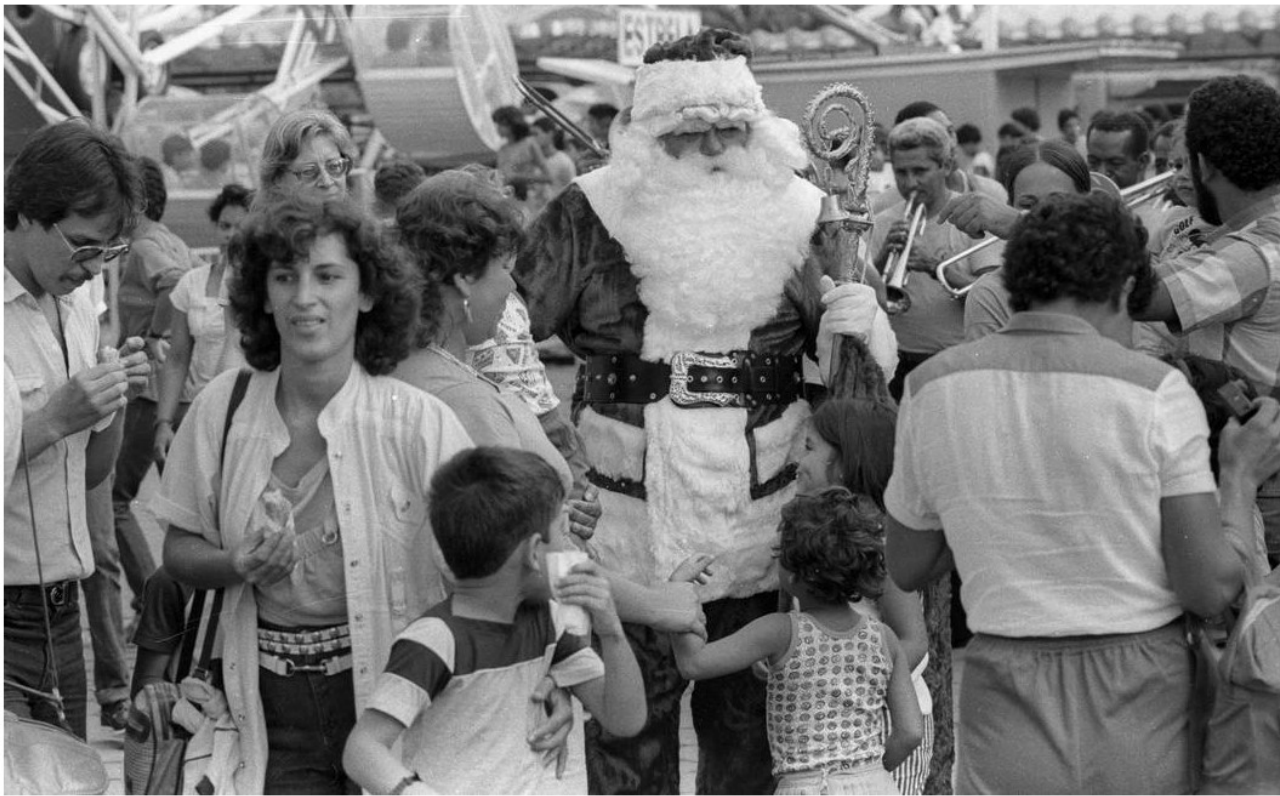
Tivoli era opção para festa de Natal para confraternização de empresas