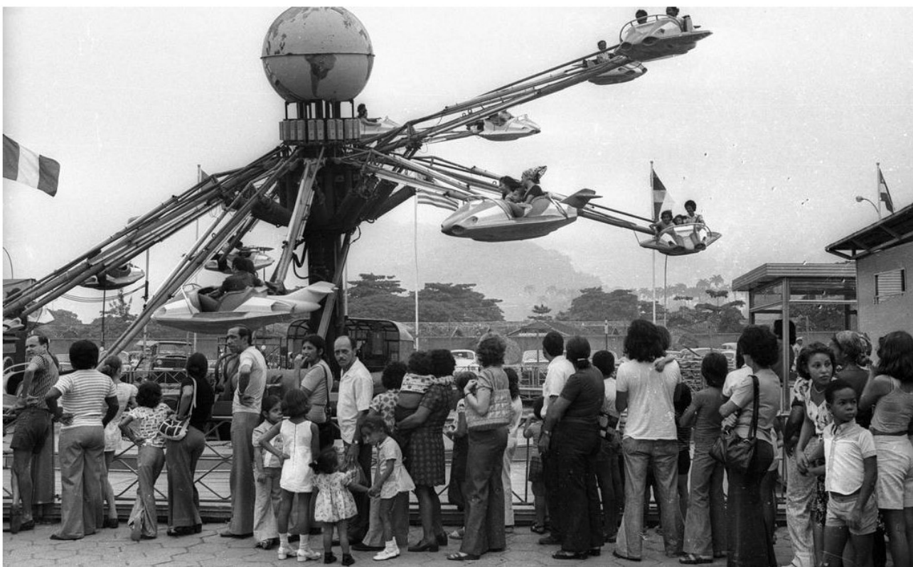
Durante muito tempo foi uma das principais opções de entretenimento da cidade