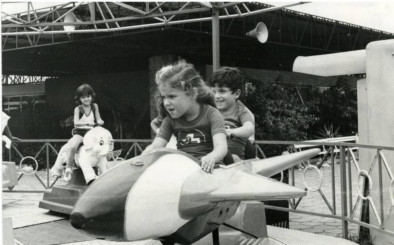
Crianças brincam em atração do Tivoli Park, na Lagoa, em 1982 (Foto: Foto: Jorge Peter / Jorge Peter / Agência O Globo)