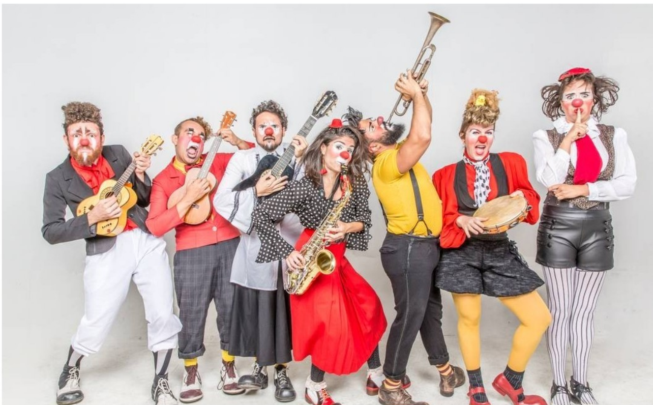
Bando de Palhaços no festival Musicar do CCBB