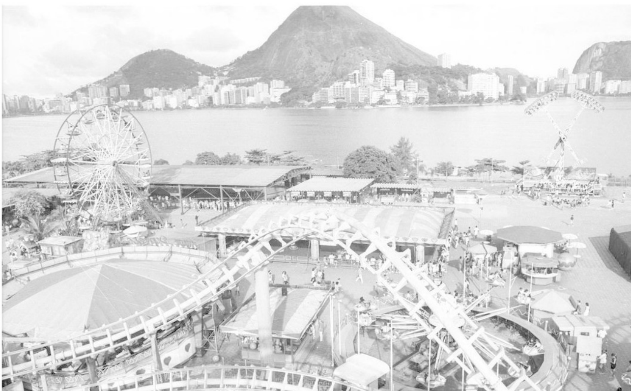
Tivoli Park