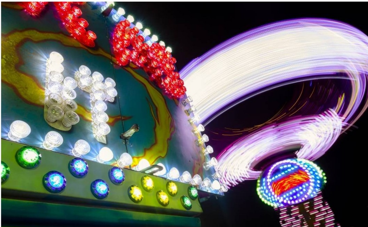
Tivoli Park reabre na Barra, ao lado do Via Parque