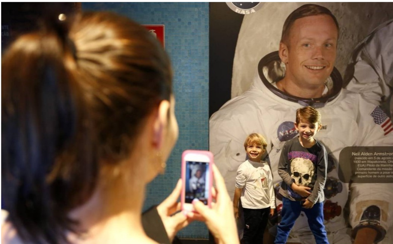
De olho no céu. O Planetário da Gávea (em foto antes da pandemia) está aberto no final de semana (Foto: foto antes da pandemia) está aberto no final de semana Foto Agência O Globo)