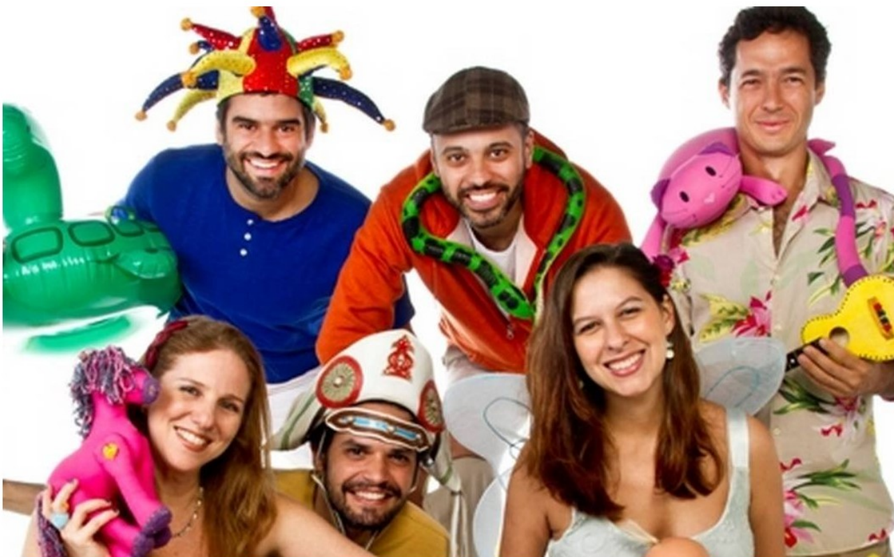
On-line. O coletivo Farra dos Brinquedos abre o festival Musicar