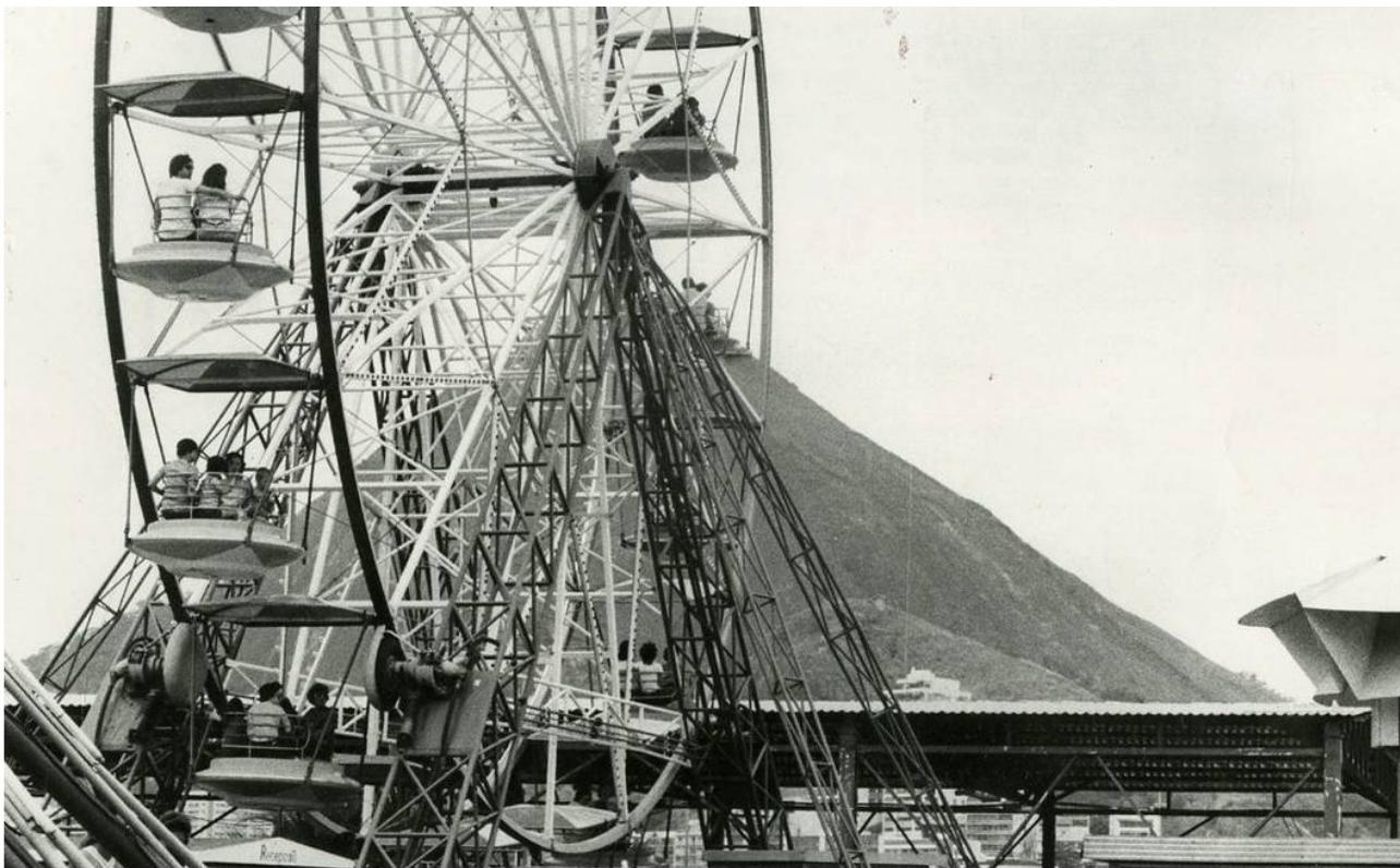
Roda gigante do Tivoli Park