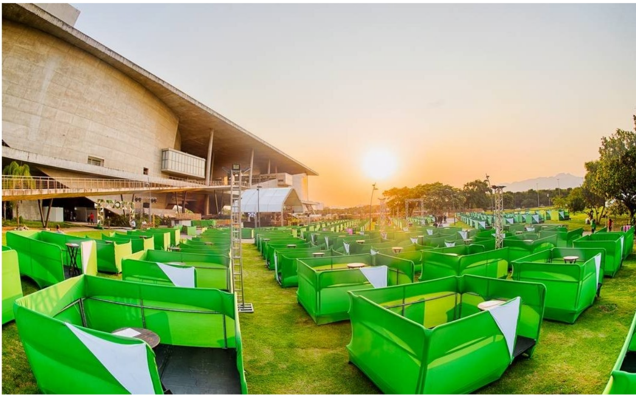
Jardim das Artes: Dia das Crianças na Cidade das Artes