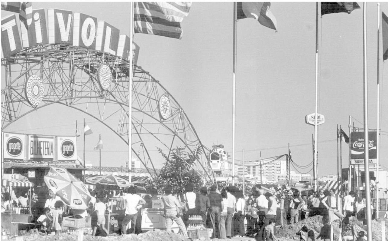
Tivoli Park, na Lagoa