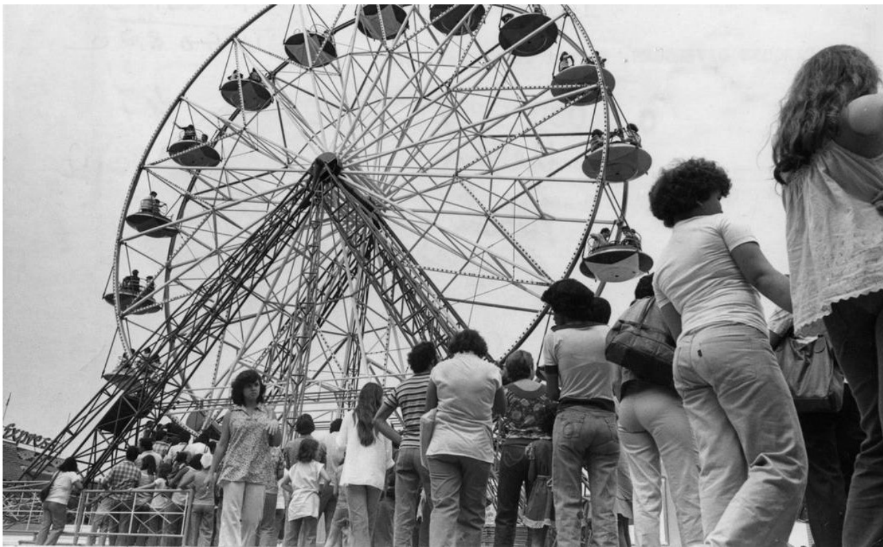
Fila para a roda gigante