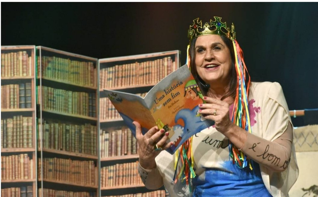
'A biblioteca cantante — Musical de Bia Bedran'