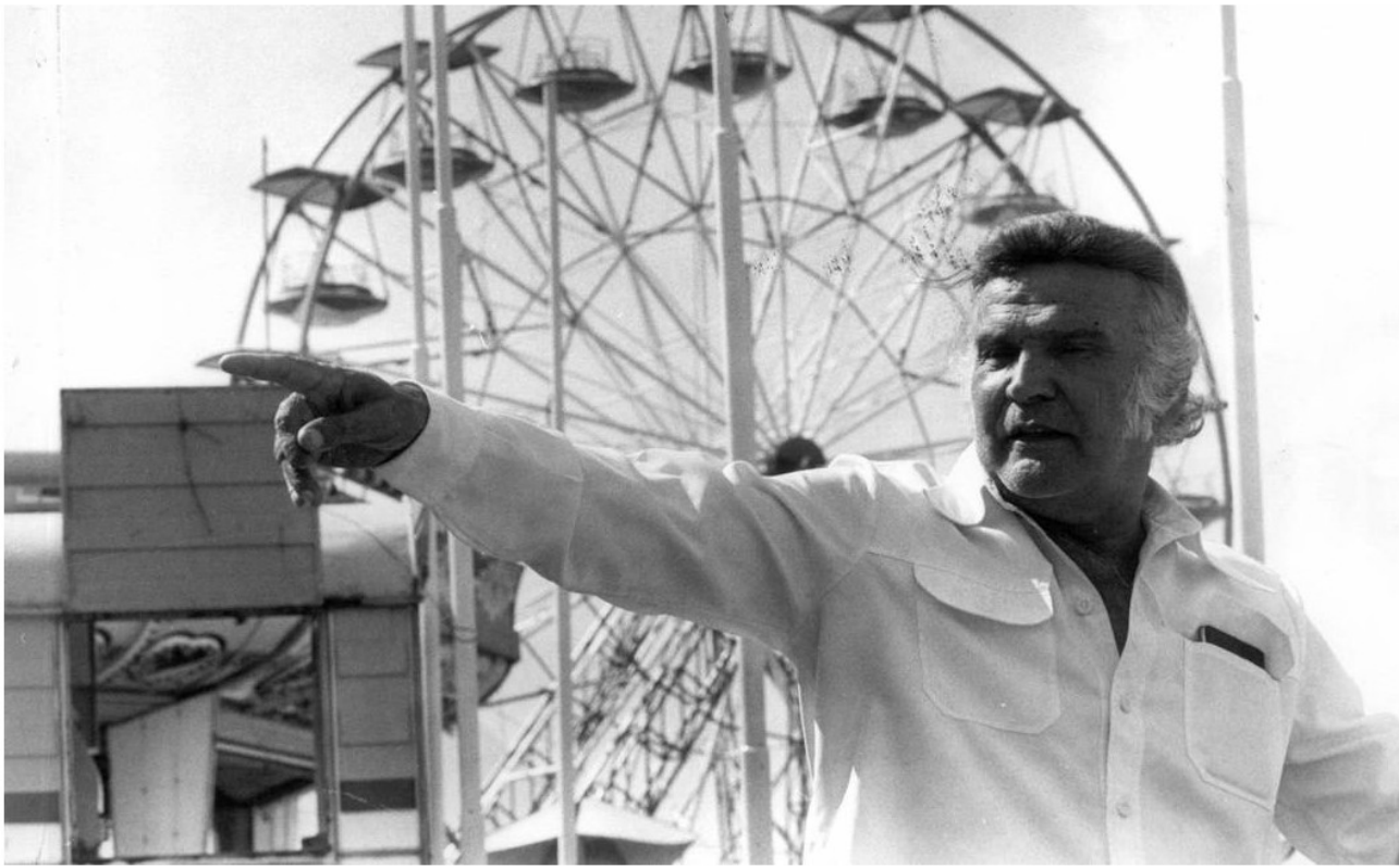
O circense italiano Orlando Orfei fundou o Tivoli Park em 1972