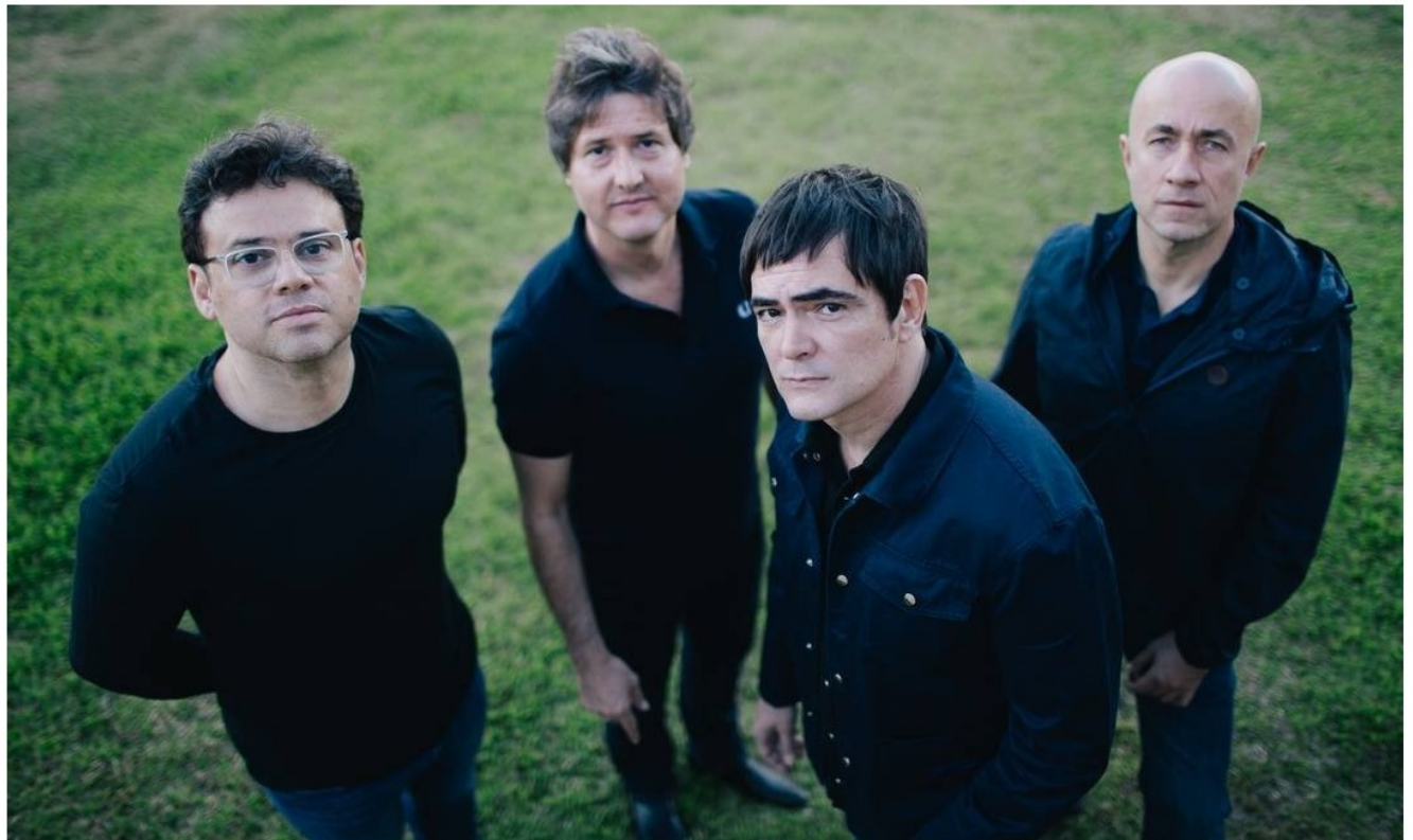
Skank se apresenta às 16h30, no YouTube.