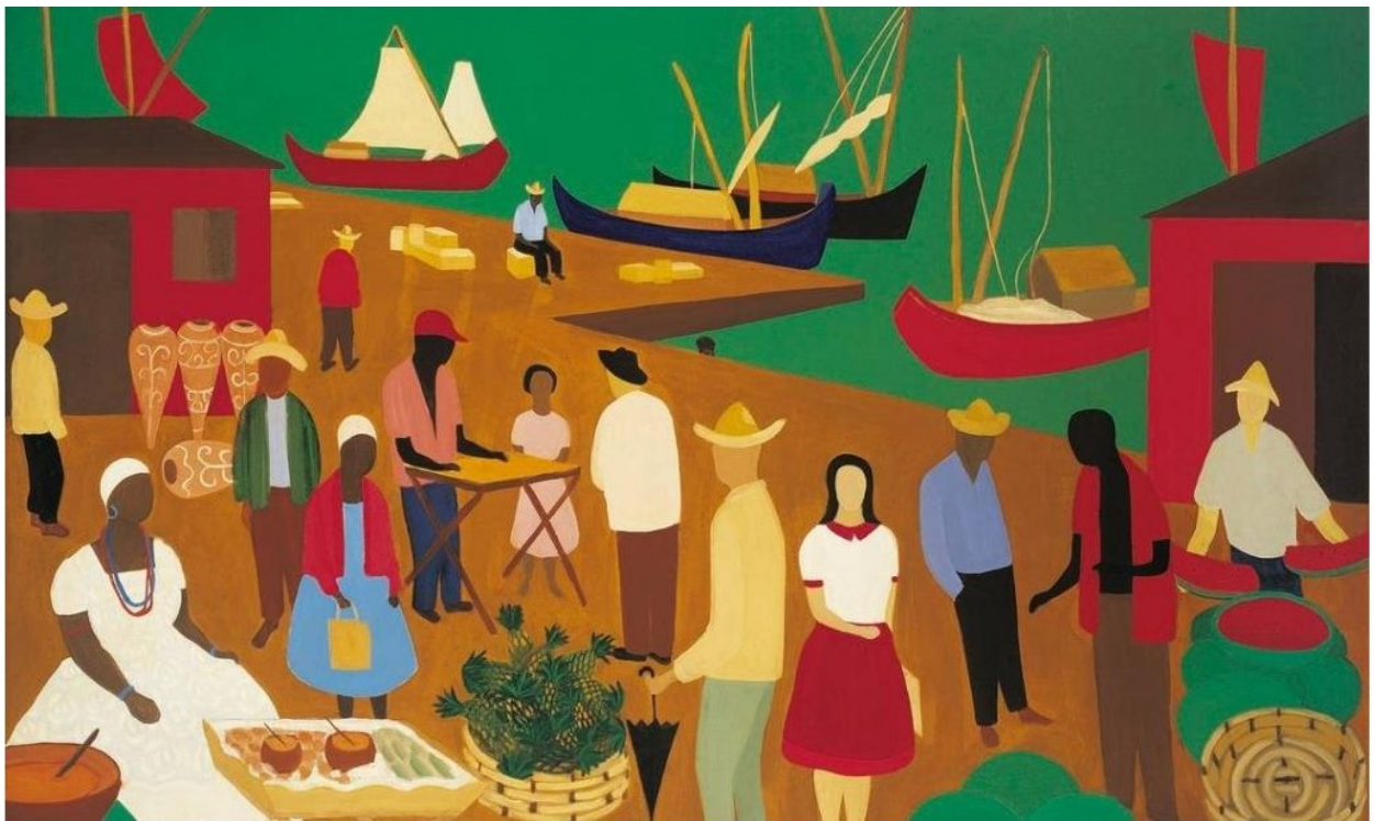
Casa Roberto Marinho: "Mercado da Bahia" (1959), de Djanira