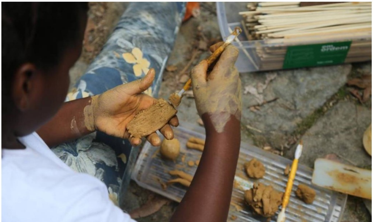
Parquinho Lage: oficina de argila