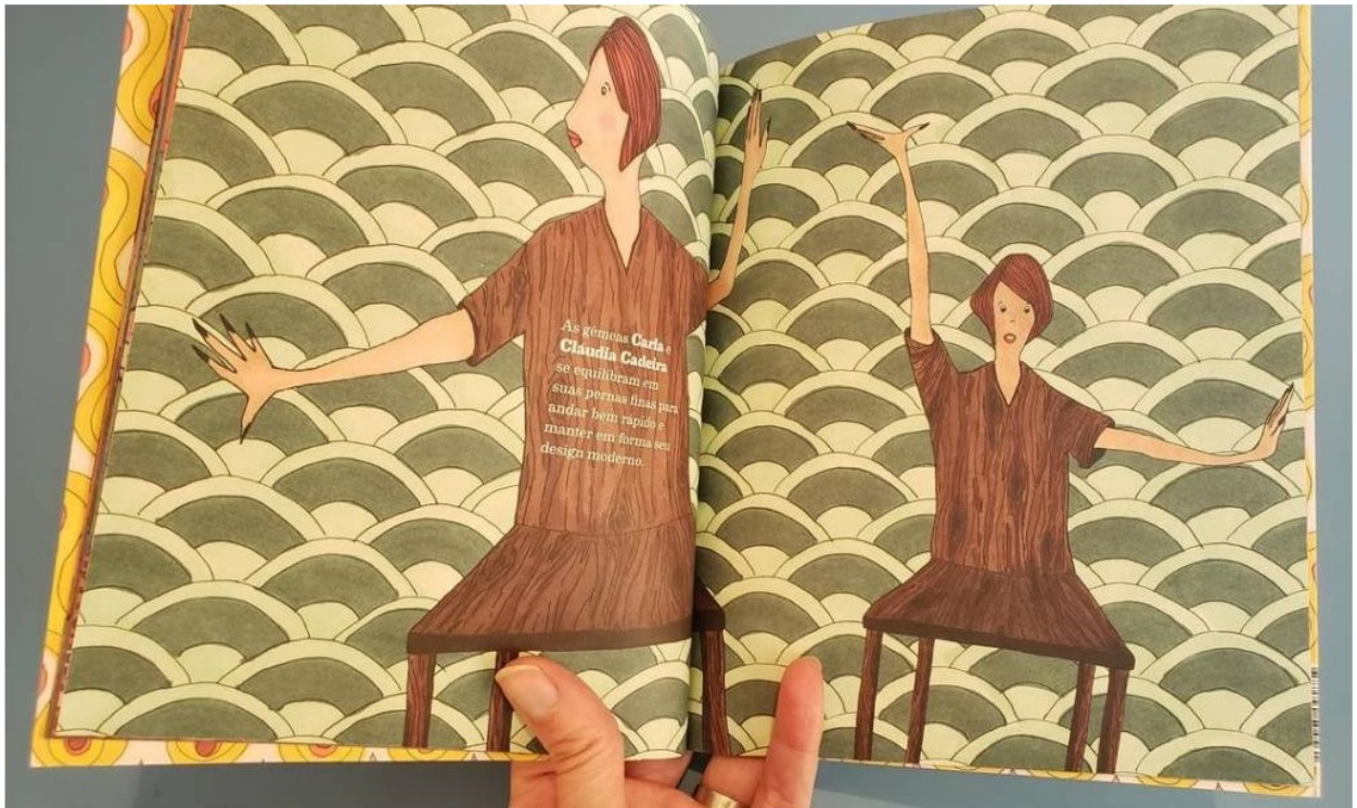
CCBB educativo: "Família mobília", livro de estreia da artista Tatiana Blass