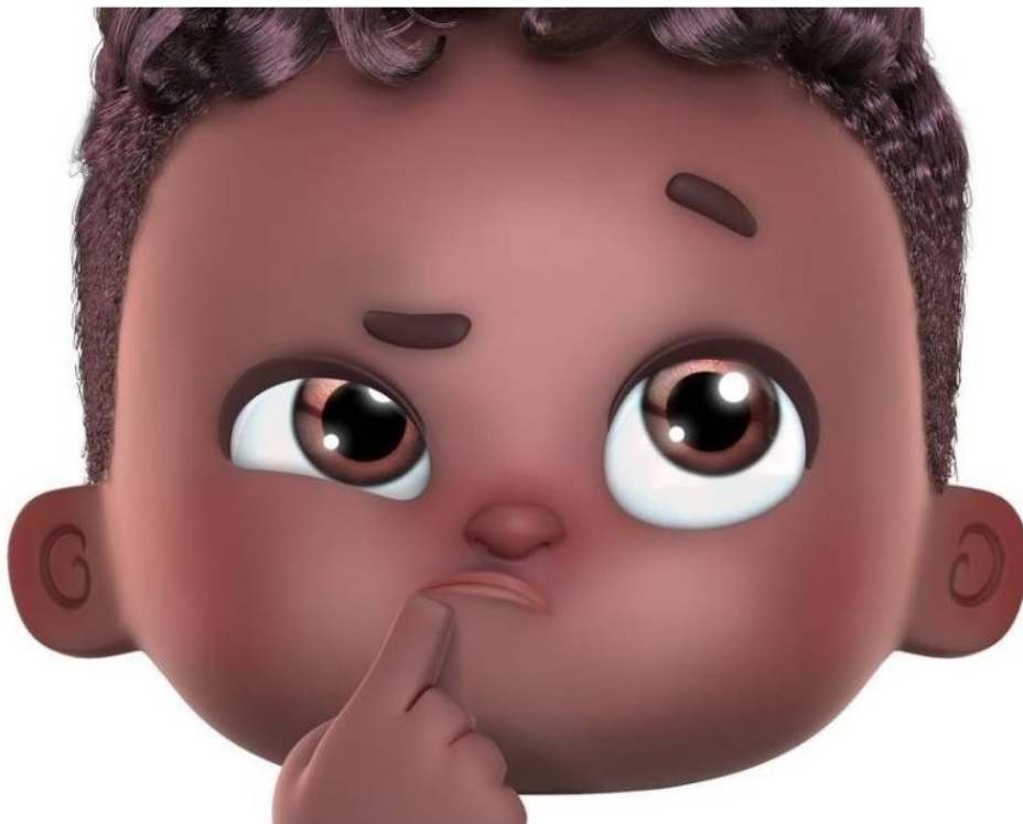
Fundação Maria Cecília Souto Vidigal: Nene^ do Zap